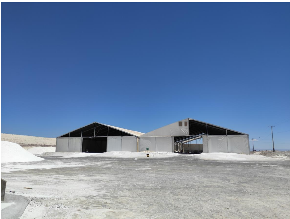
Imagen 21 - Galpón almacenamiento secado.