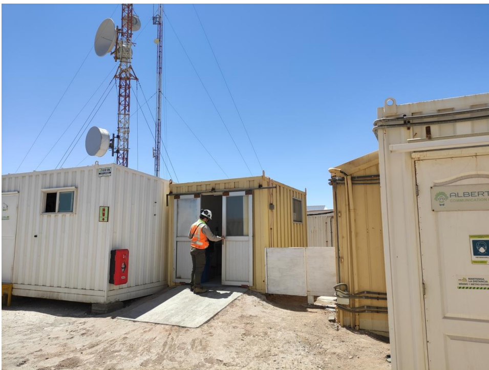
Imagen 7 – Baños, sala albert, sala de almacenamiento de basura.