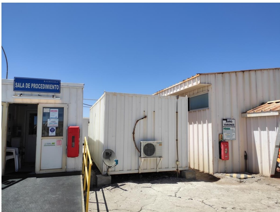
Imagen 9 – Bodega primeros auxilios.