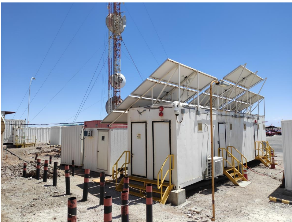
Imagen 8 – Sala de comunicaciones, contenedores administración, sala de aislamiento respiratorio covid 19.