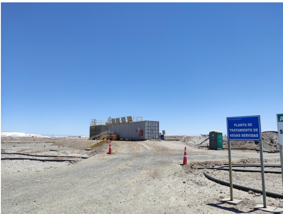
Imagen 14 - Sector PTAS.