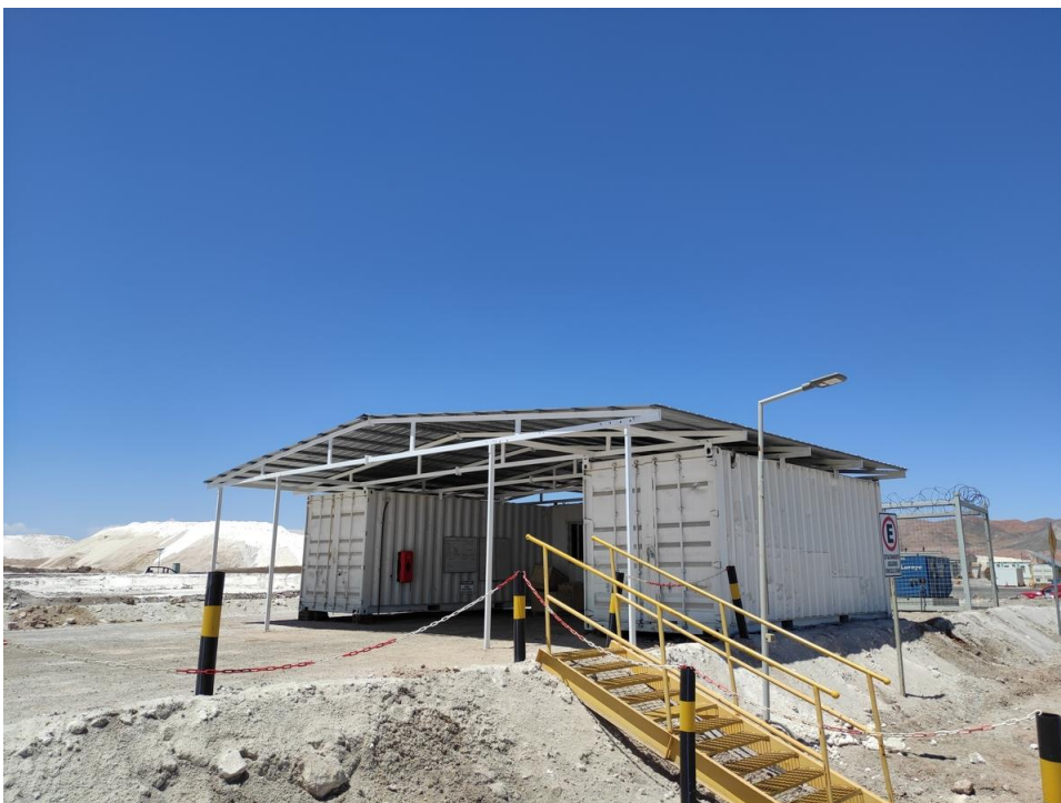
Imagen 13 – Bodegas operaciones pozos.