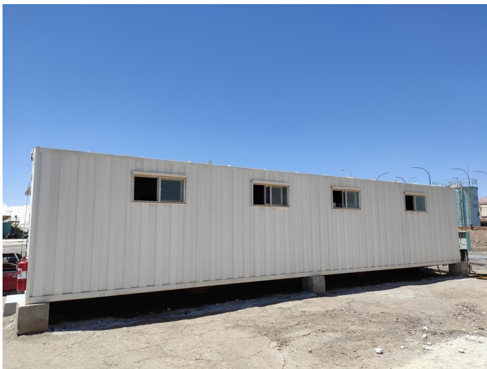
Imagen 10 – Camarín exterior.