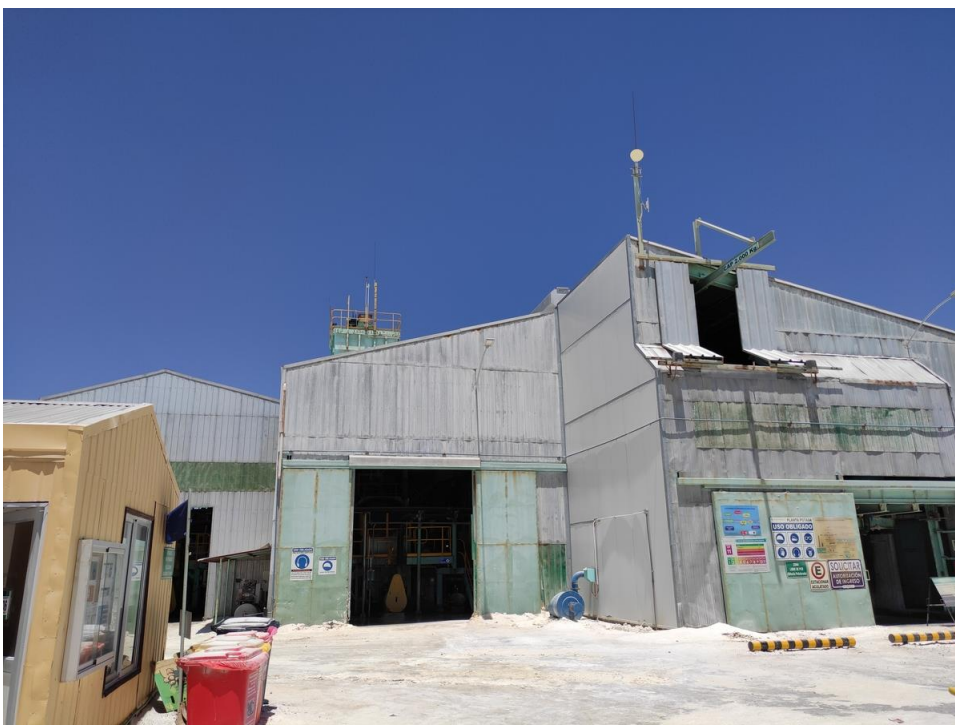
Imagen 22 - Galpón planta potasa.