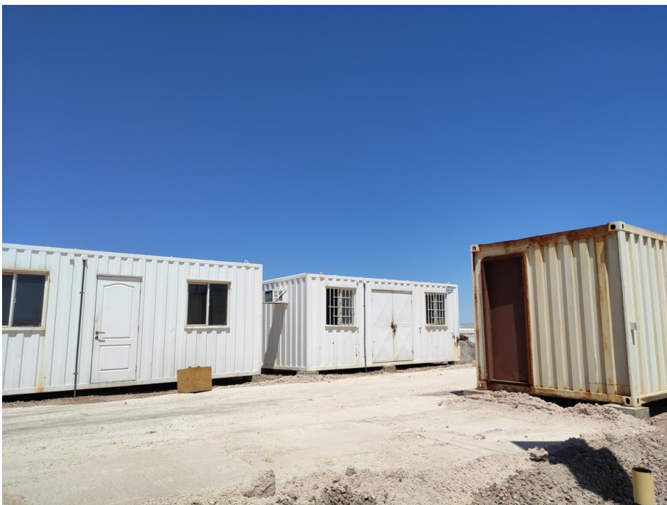
Imagen 3 – Bodegas exteriores recintos administrativos.