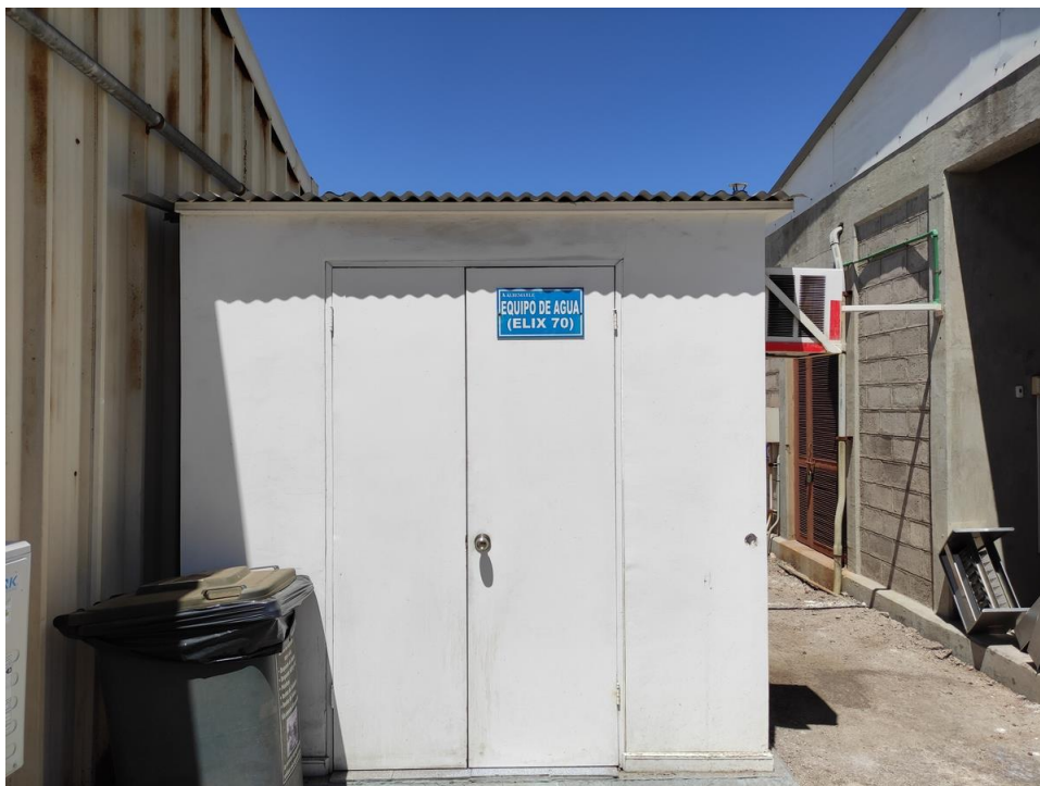
Imagen 5 – Equipo de agua.