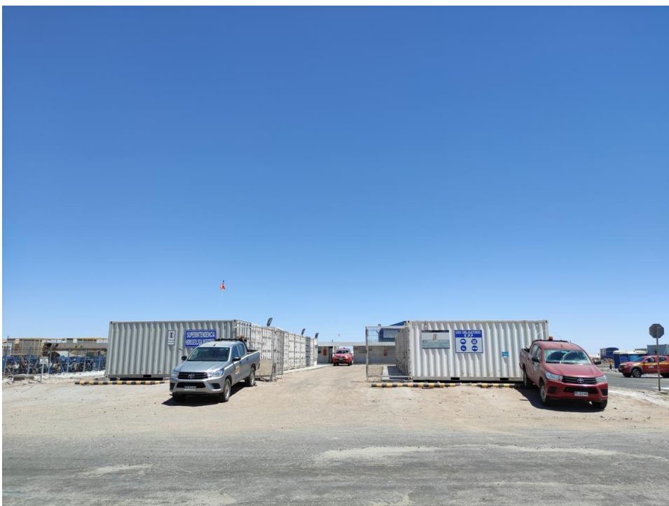
Imagen 12 – Conjunto de contenedores muestrera hidrogeología.