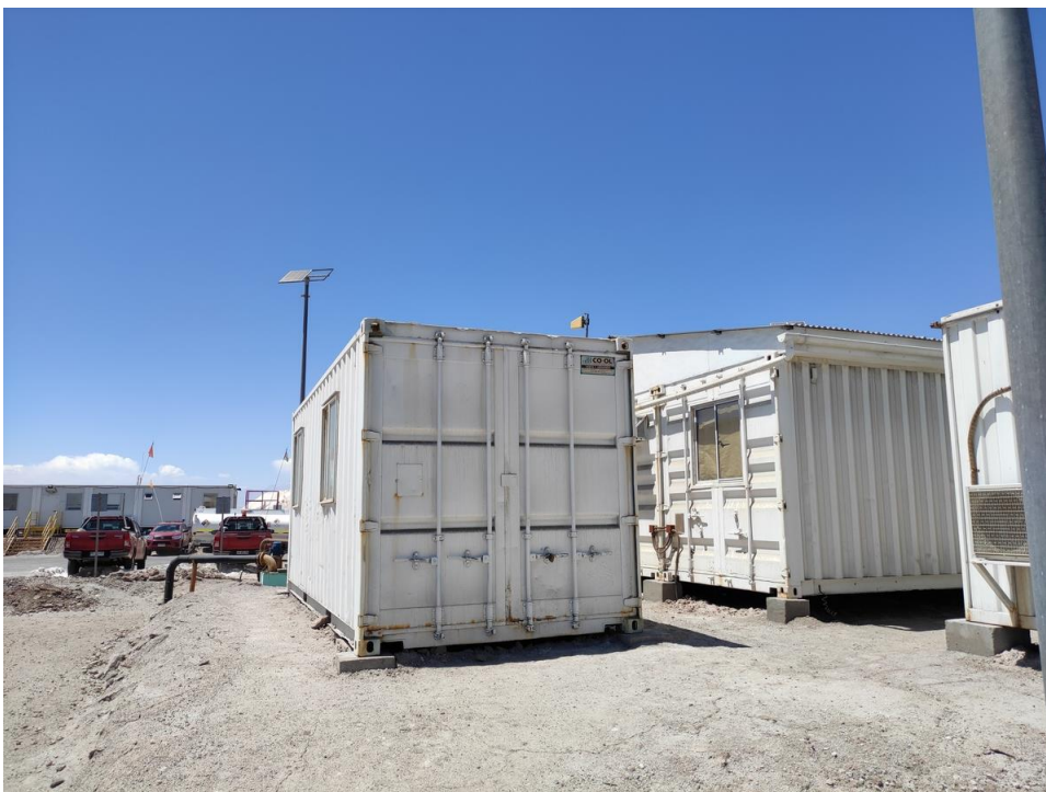
Imagen 11 – Bodega departamento medio ambiente.