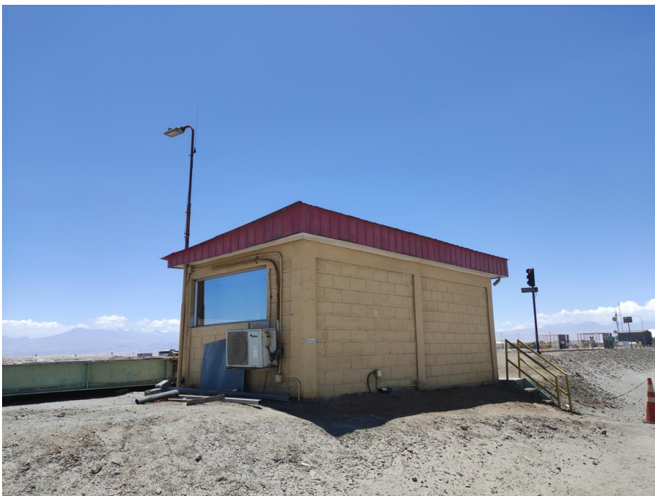
Imagen 19 – Oficina pesaje.