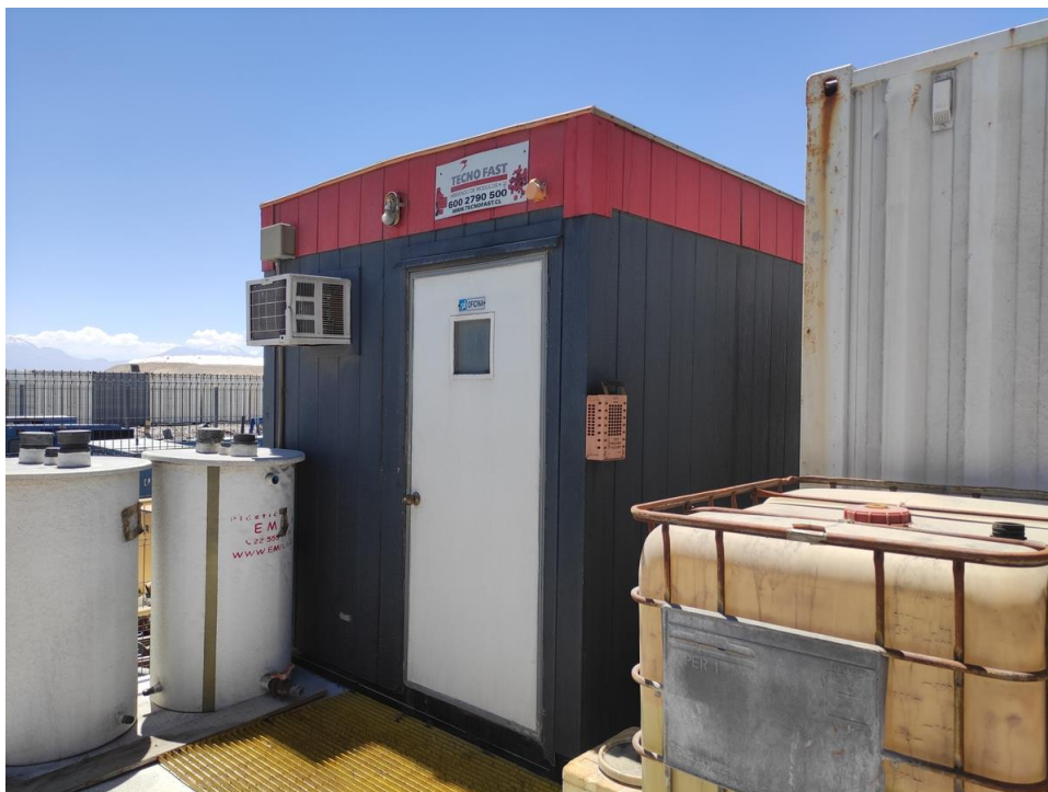
Imagen 15 – Bodega almacenamiento nanofiltración.