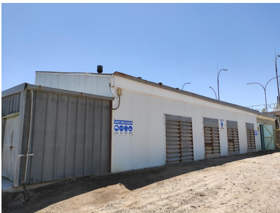
Imagen 2 – Sala generador casa fuerza.