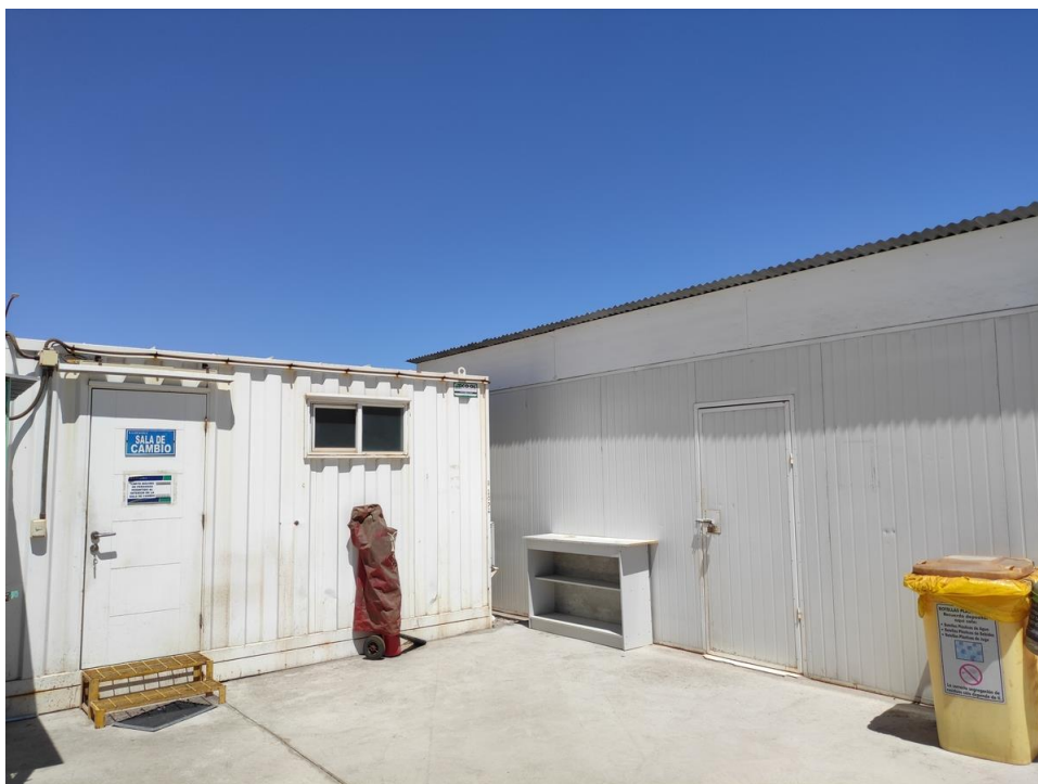
Imagen 6 – Sala de cambio laboratorio.