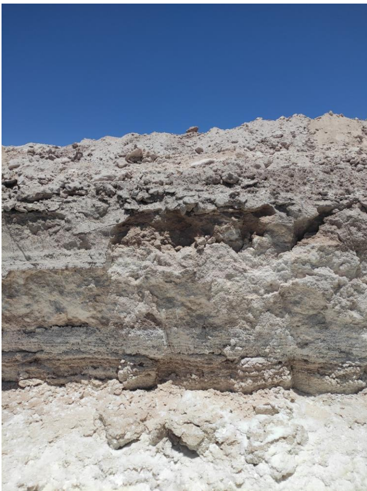
Imagen 25 – Perfil de suelo área del proyecto.