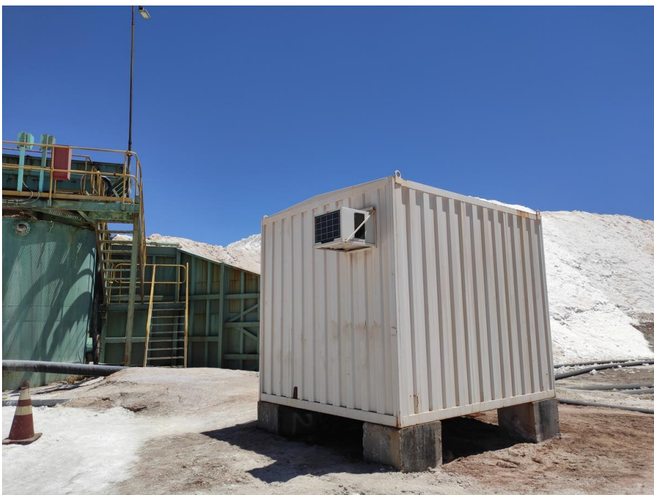
Imagen 20 – Oficina lixiviación 2.