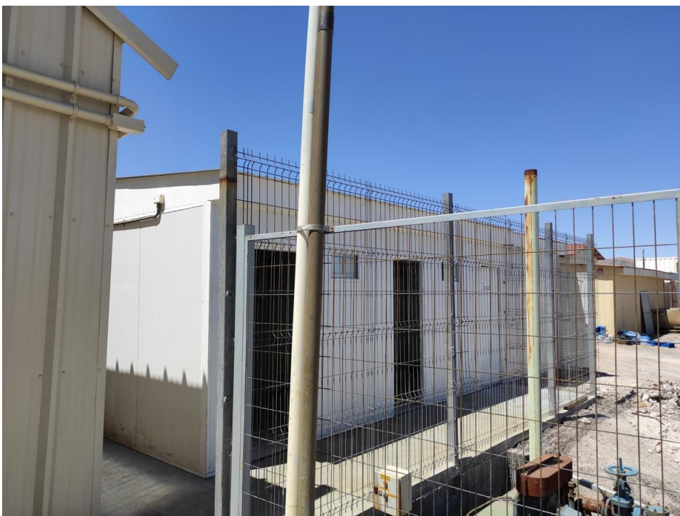
Imagen 4 – Sala de cambio comedor.