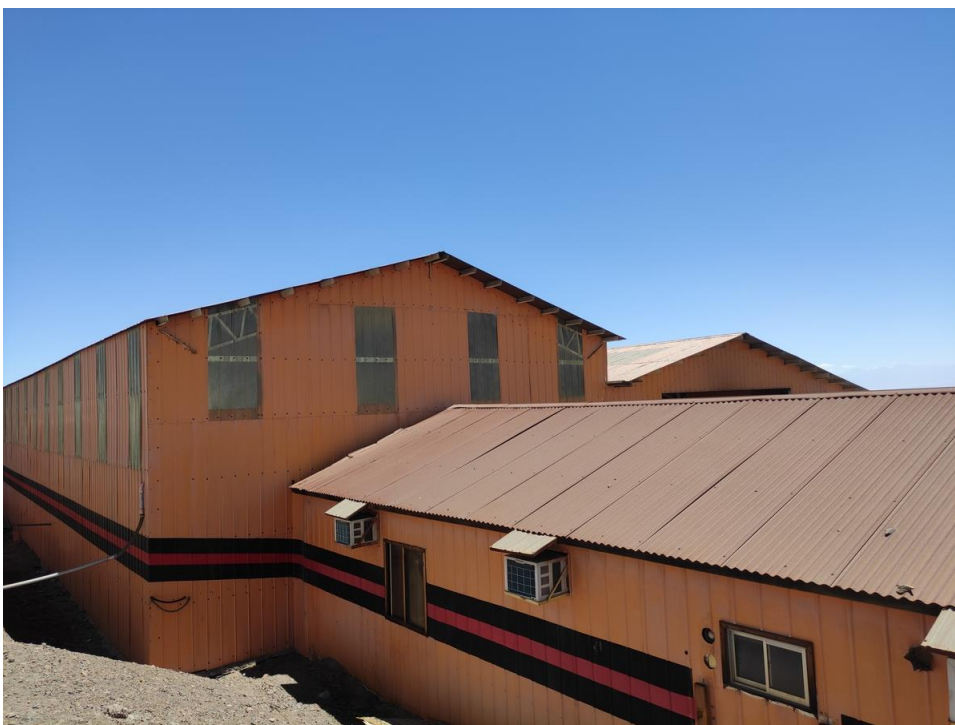
Imagen 18 - Galpón mantención vehículos pesados.