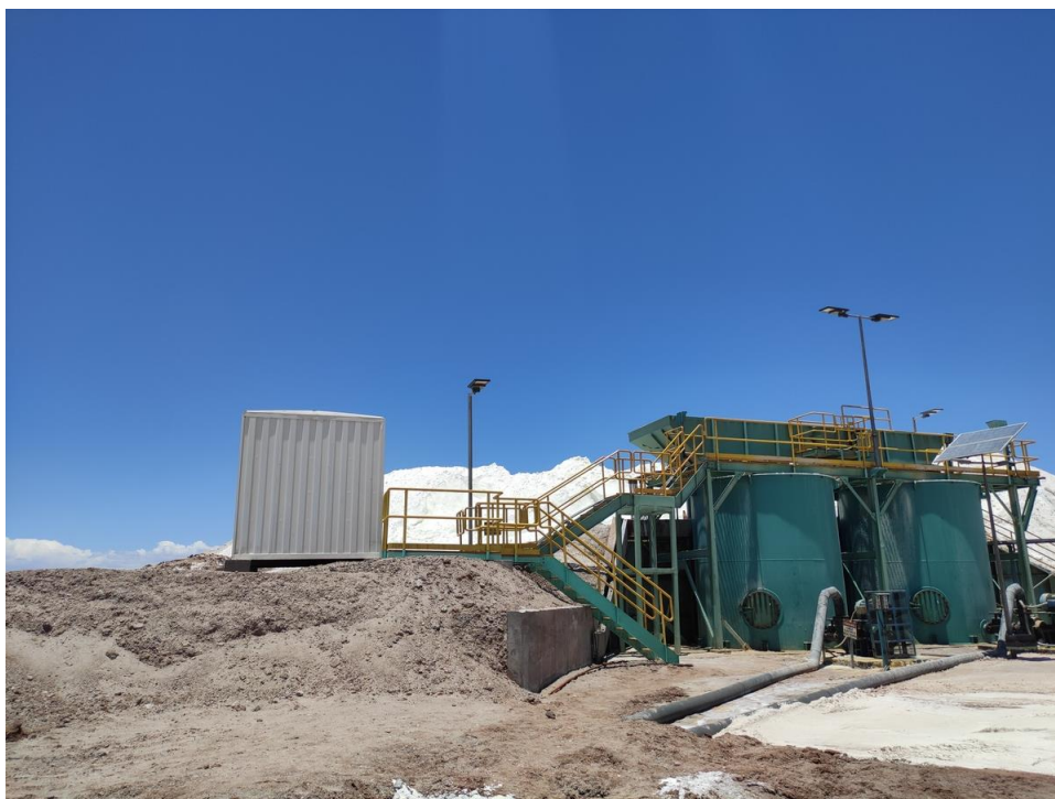
Imagen 1 – Recintos complementarios oficina de lixiviación 1.