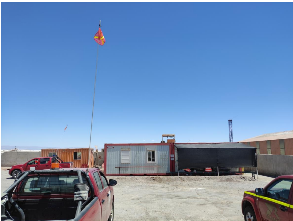
Imagen 17 – Comedor recinto contratistas.