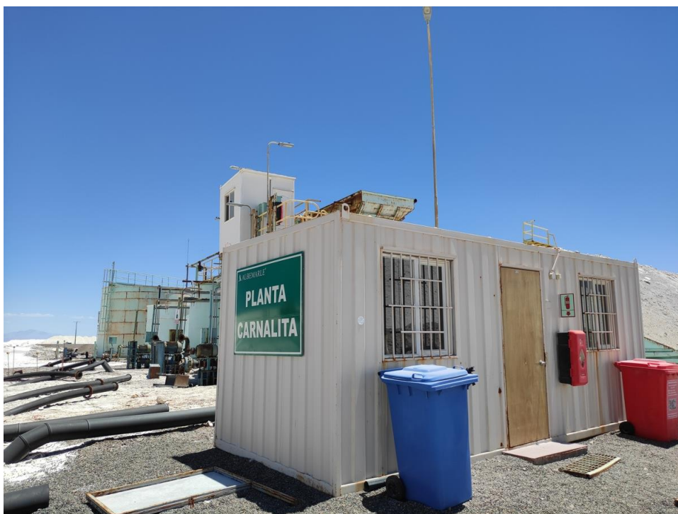
Imagen 23 – Oficina 2 carnalita.